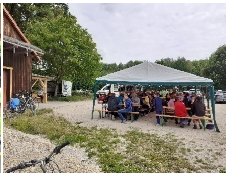
12.06.2021 „Fisch vom Grill“ am Marktplatz in Freystadt