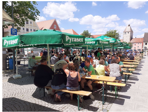
10.09.2021 Schnupperfischen – Ferienprogramm